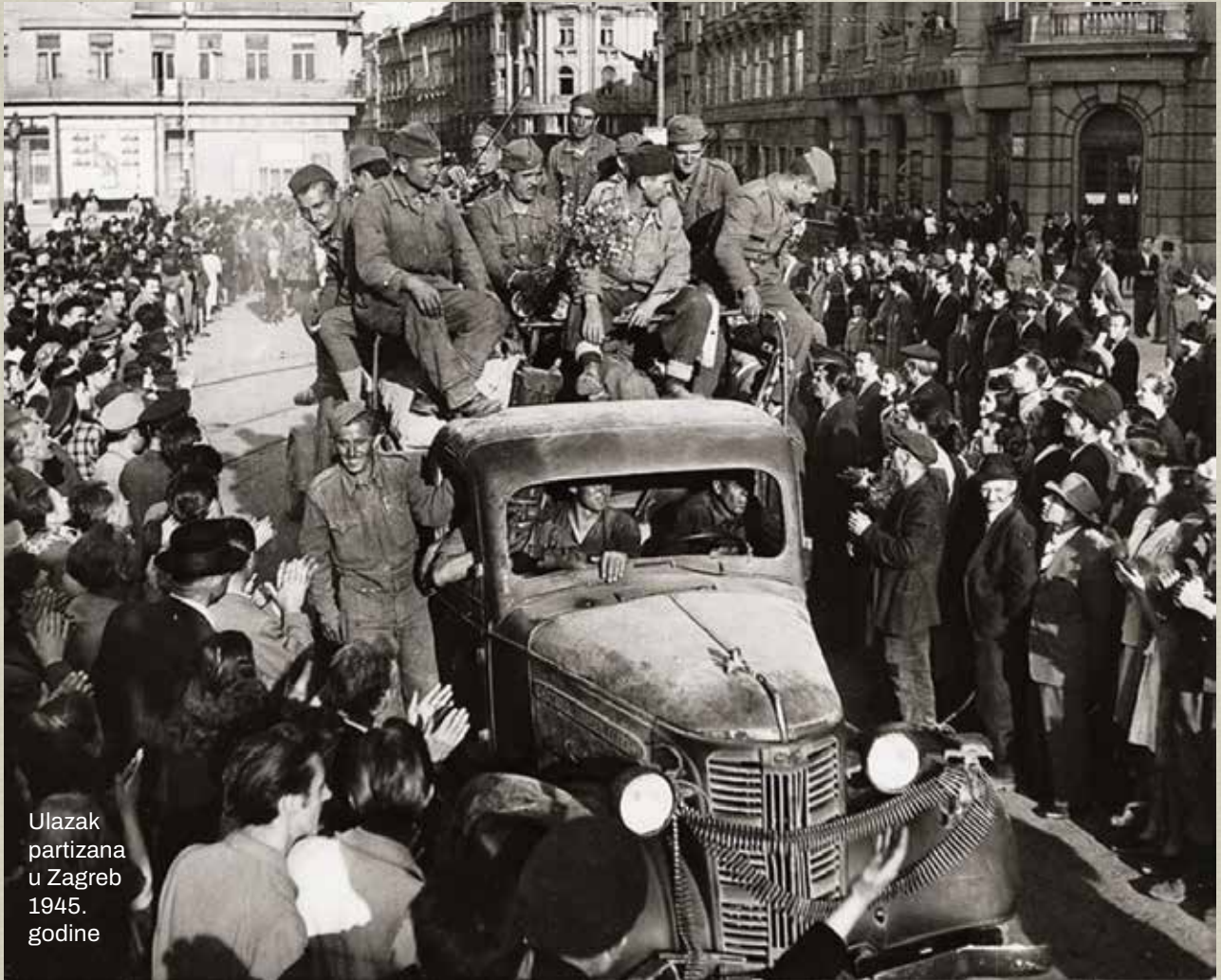
Ulazak partizana u Zagreb 1945. godine